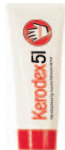
Kerodex 51 41422 tube, 100 ml 41431 tube, 250 ml

Den vannopløselige beskyttelseskreem Kerodex 51 er spesielt utviklet til arbeide hvor hendene forurenses av oljeprodukter, maling og trykkfarger basert på olje, f. eks. innenfor metallindustrien, skipsfart, farge og lakkindustrien og på verksteder. Kerodex inneholder ikke silikon og parfyme.