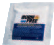
BurnFree kompress 5 x 5 cm 94391