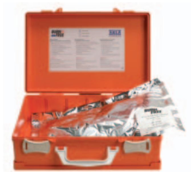
BurnFree branskadeteppe 94382BF BurnFree teppe i koffert, 91 x 76 cm 94384BF BurnFree teppe i koffert, 183 x 152 cm 94385BF BurnFree teppe i nylonbag, 244 x 152 cm