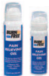
BurnFree lindrende gel. 50 ml sprayflaske 94397 BurnFree lindrende gel. 100 ml sprayflaske 94398