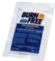
BurnFree kompress 10 x 10 cm 94393