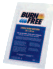
BurnFree kompress 20 x 20 cm 94377BF