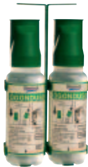
Sterisol veggfeste Øyedusj veggfeste for 2 x 1 liter flasker med festebrakett til vegg. Stativet henges på medfølgende brakett. Det kan derfor enkelt løftes ned fra vegg og tas med ved behov. 1243