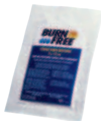
BurnFree kompress 5 x 15 cm 94395