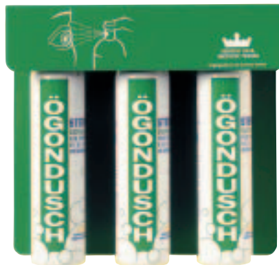
Øyedusjstativ Inkludert 3 bokser 9003040 9003041 refill med 3 flasker