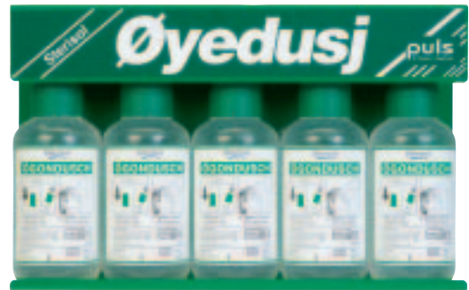
Sterisol veggfeste Veggstativ med 5 flasker 1245