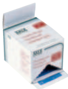
BurnFree lindrende gel. Dispensereske med 20 poser à 3,5 gram 94390