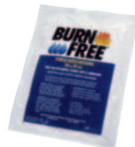
BurnFree kompress 30 x 30 cm 94379BF